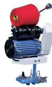
Портативная модель FSM-05-P для фабрик и дома