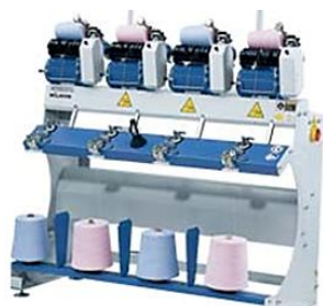
4 головы FSM-05-4