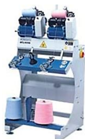
2 головы FSM-05-2