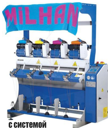
с системой роспуска полотна SM-01-4