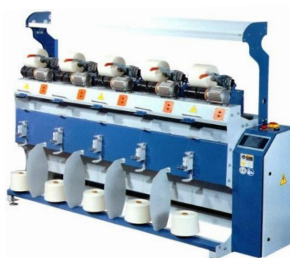
для перемотки цилиндрических бобин SM-02-5